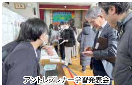
アントレプレナー学習発表会

両小野中学校は塩尻市北小野地区と辰野町小野地区の2つの行政区からなる組合立の学校です。平成23年度から両小野小学校と両小野中学校で小・中一貫教育を行う「両小野学園」として始まり、現在は保育園も含めて特色ある教育に取り組んでいます。