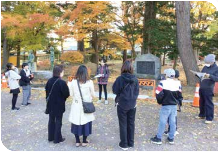
写真：塩尻市立広丘小学校「自分たちの学んだ広丘を紹介します！6年生 みてある記」 撮影日 2025.11.18