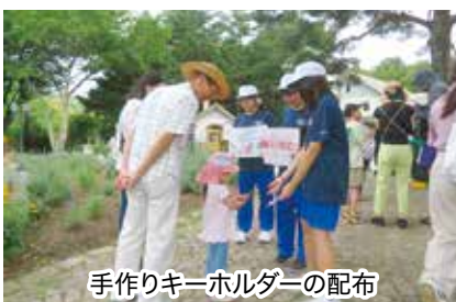
手作りキーホルダーの配布

3学年では、「地域の未来を考えよう」をテーマに、地域の課題を調べ、自分たちにできることを考えました。学習の成果は辰野町の「ほたるの里中学生議会2025」での発表や、霧訪山へのベンチの設置、日本ど真ん中