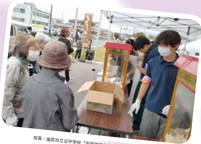
写真：塩尻市立丘中学校「吉田地区お祭りでのボランティア活動の様子」 撮影日 2025.10.19