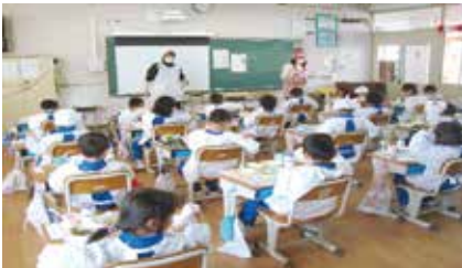
1年生4月初めの給食

宗賀小学校の児童、職員合わせて約230人分の給食を、給食調理員さん3名と、栄養士の先生1名で美味しく作って頂いています。