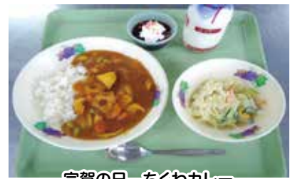
宗賀の日 ちくわカレー