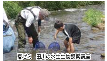
夏ゼミ 田川の水生生物観察講座