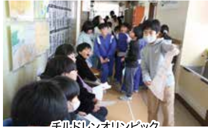
チルドレンオリンピック

気で聴き合う仲間になろう〜」です。児童はあいさつ、交流、美化、短歌を重点活動に、教師は子どもの声を聴けることを本気目標に据え、目標の具現に向け取り組んでいます。12月上旬には「短歌の日」として、塩尻短歌館の方をお迎えして、短歌を書くときのコツを教えていただいたり、想像力を膨らませる活動を実施していただいたりしました。また児童会の各委員会が様々なブースを設け、姉妹学級のグループで回る「チルドレンオリンピック」では、学年関係なく楽しく関わり、交流の場を広げることができました。代表委員会による「あいさつの日」や、清掃前の黙想タイムも目標達成に向けた大切な活動として位置づいています。