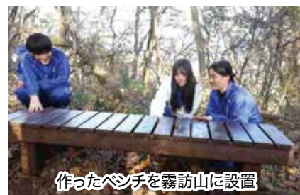
作ったベンチを霧訪山に設置