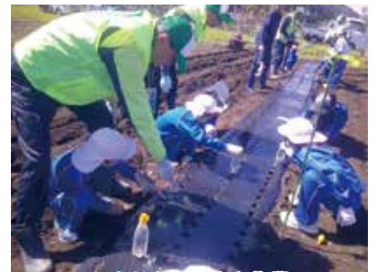
にんじんの種まき作業